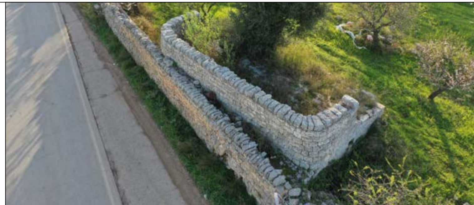
Vista da Nord-Est