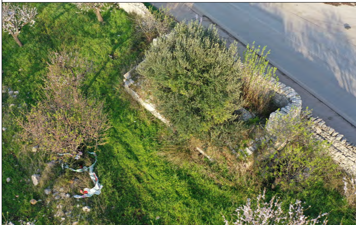
Vista da Sud-Ovest