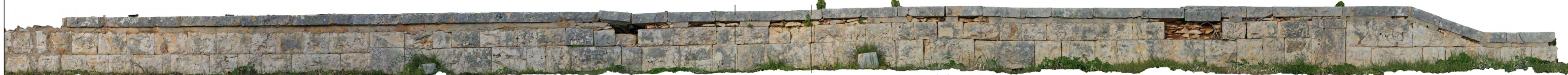
Prospetto fronte strada