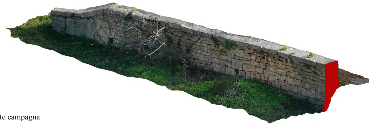
Vista fronte campagna