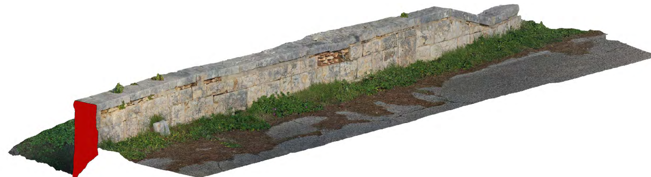
Vista fronte strada