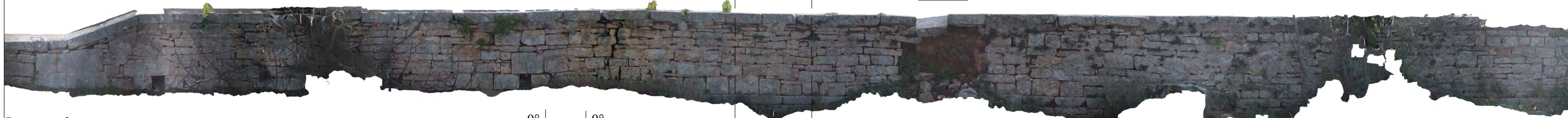
Prospetto fronte campagna